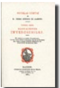
Narraciones inverosímiles, de Pedro Antonio de Alarcón Libro de la Feria 2012